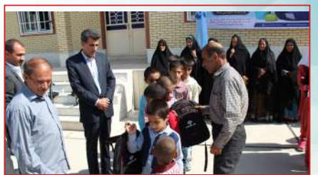
کهگیلویه و بویراحمد