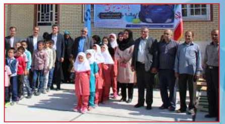
کهگیلویه و بویراحمد